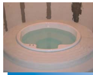
De whirlpool die in de fabriek werd voorgefabriceerd inclusief platform wordt nauwkeurig passend opgebouwd op de bouwplaats.