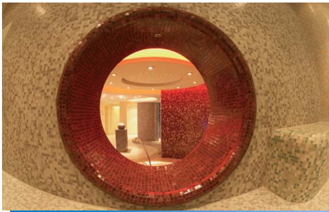
De patrijspoort biedt inzicht in het zwembad of in het saunabereik, afhankelijk van de locatie.

De exclusieve productlijn LUX ELEMENTS®-CONCEPT dient ter verwezenlijking van individuele vormgevingswensen. Een eigen planningsafdeling helpt bij detailoplossingen en stelt de werkplannen op. De fabricage van de elementen die nauwkeurig op maat van het object zijn afgestemd, gebeurt in het moederbedrijf in Leverkusen.