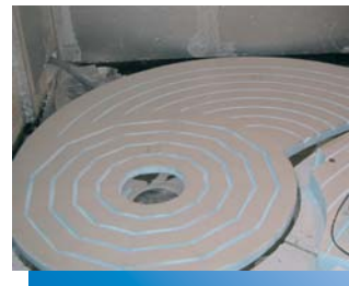
De bodem van de slakkenhuisvormige douche tijdens de montage. De afzonderlijke elementen moeten ter plaatse enkel nog worden gemonteerd en vastgekleefd.