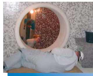
De patrijspoort tijdens de betegeling met glasmozaïek.