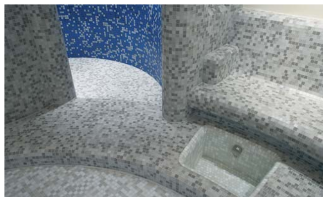
... na de oplevering. Daarachter is de warmtebank te zien, eveneens gemodelleerd met dragende hardschuimelementen.

LUX ELEMENTS produceert milieuvriendelijke dragende hardschuimelementen (EPS) van eigen fabricage zonder gebruik te maken van CFK's, HCFC's, HFK's of CO 2 . Zo zijn de hoge kwaliteit en deugdelijkheid altijd gewaarborgd. Polystyreen hardschuim bezit zeer goede bouw fysische eigenschappen die corresponderen met een zeer goede bewerkbaarheid.