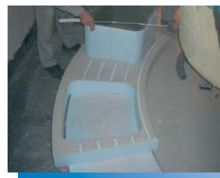
Het voetbad tijdens de montage en ...